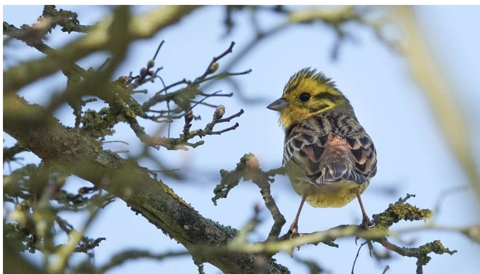
Bruant jaune 24/03