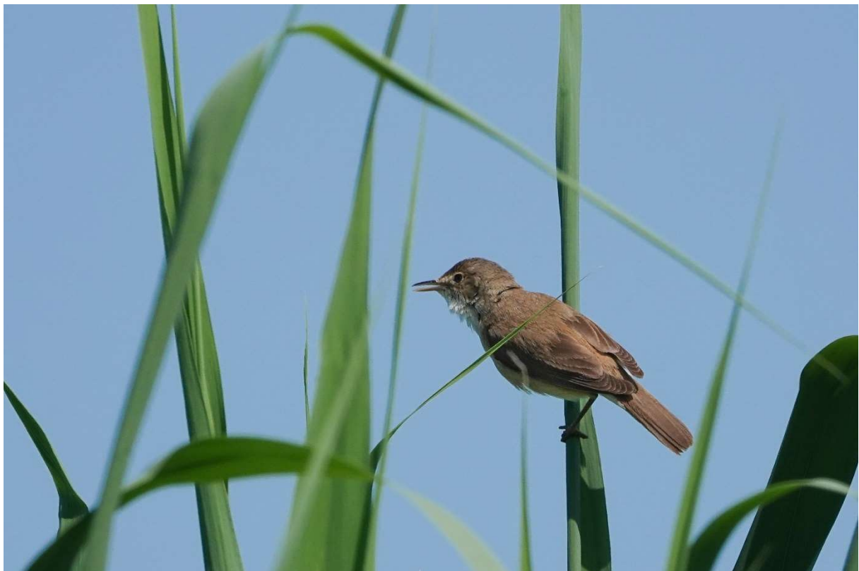
Rousserolle effarvatte step Vieux/Avenay, sur son poste de chant (en haut à droite) et chanteuse (ci-dessus) en juin