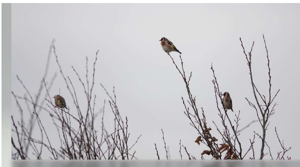
Chardonnerets élégants 16/12